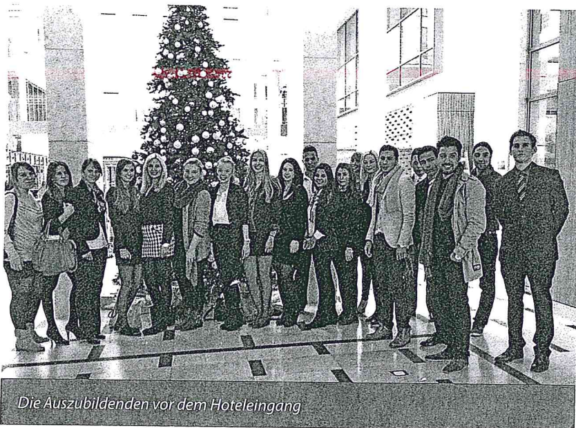
Die Auszubildenden vor dem Hoteleingang

Am 13. Dezember 2013 besuchte die Klasse TK131 (Auszubildende zur/-m Tourismuskaufrfrau/-kaufmann) des Willy-Brandt-Berufskollegs Duisburg-Rheinhausen das Hotel Intercontinental in Düsseldorf für eine Exkursion.